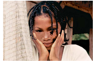
Der Bürgerkrieg in Kolumbien verursacht immer noch großes Leid.

In den letzten Jahren hat das Sonderprogramm Kolumbien mehrfach auf Morddrohungen, willkürliche Verhaftungen und andere Menschenrechtsverletzungen reagiert. Dadurch konnten bedrohliche Situationen entschärft und Gewalt verhindert werden, zum Beispiel im Falle der Friedensgemeinde am Cacarica-Fluss, die